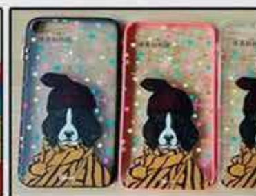
Soft phone case