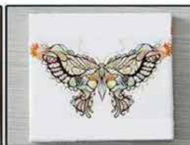
PVC foam board